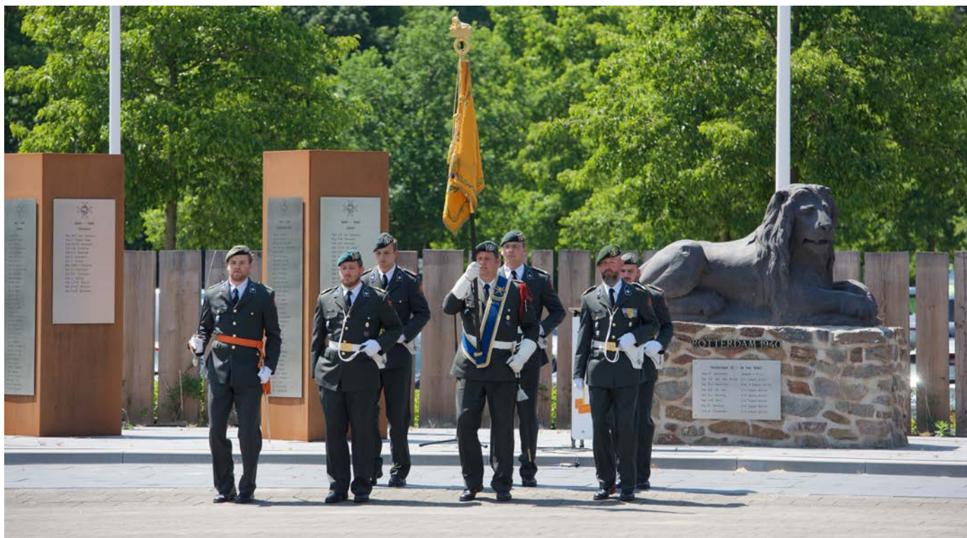
Het vaandel en de vaandelwacht betreden het Veteranenplein

Op het Veteranenplein, waar de ceremonie plaatsvindt, staat een afvaardiging van het C2OstCo opgesteld. Naast hen zijn er ook collega's van andere eenheden aanwezig. Net als familie, vrienden, generaals, de burgemeester van Barneveld en partners uit het bedrijfsleven en van onderwijsinstellingen: zij zullen vanmiddag allemaal getuige zijn van de commando-overdracht. De muzikale omlijsting is in handen van de Koninklijke Militaire Kapel Johan Willem Friso.