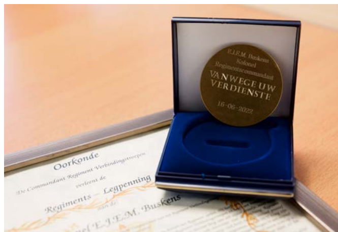
De regimentslegpenning en bijbehorende oorkonde voor Kolonel Buskens