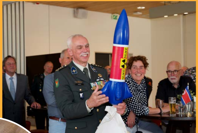
De enige officier binnen de KL met een eigen kernraket