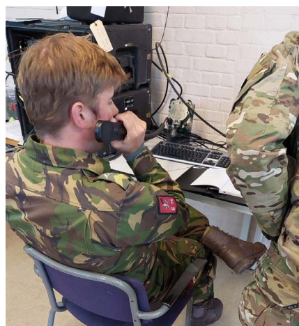
PA5MIL op de thuisbasis in actie

Op initiatief van hun directe chef, sergeant-majoor Ton (volledige naam is bij de redactie bekend) is er begonnen met een unieke activiteit onder de naam HAM MEETS MIL, een ontmoeting van radioamateurs met militairen. Ruim tevoren heeft sm Ton al contact gezocht met enkele radioamateurverenigingen in het buitenland, van wie hij verbaasde maar positieve reacties ontving. Van het Agentschap Telecommunicatie heeft hij onder bepaalde voorwaarden toestemming gekregen om gedurende twaalf uur deze activiteit te laten plaatsvinden. De acht betrokken militaire radiostations moeten gebruikmaken van goed herkenbare roepnamen (PA01MIL t/m PA08MIL) en er moet een gelicenseerde radioamateur aanwezig zijn. Ton heeft zelf bepaald dat uitsluitend organieke militaire radioapparatuur moet worden gebruikt, maar ondersteuning van Nederlandse radioamateurs is toegestaan. De auteur (zelf radioamateur) heeft intussen in Nederland en België al dagen