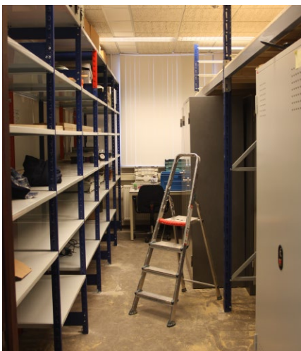
Aanpassing van de ruimten

Ondanks de coronaperikelen hebben we er toch weer een aantal vrijwilligers bijgekregen voor met name de afdeling Behoud en Beheer en voor de inrichting van onze ICT-systemen. Daarmee komt het aantal vaste medewerkers op 25. Daarnaast hebben we nog elf oproepkrachten. En ook hebben we nog twee door Capgemini ter beschikking gestelde studenten HBO-ICT die zich bezighouden met de reanimatie van onze touchtable waarop we de Verbindingsdienst op de kaart weer willen presenteren.