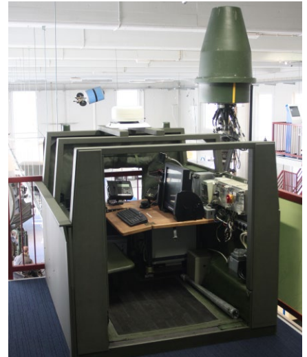
Wide Eye in de eov-hoek