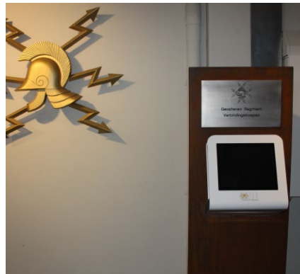
De zevende zuil van het monument

mogelijk wordt. We hebben daarvoor echter wel een groot deel van de uniformstukken weg moeten doen.