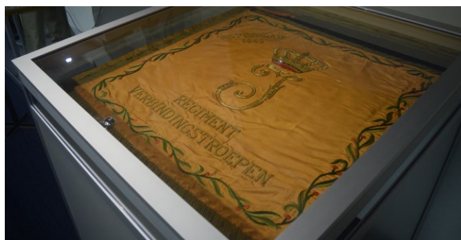
Het vaandel in de nieuwe vitrinekast