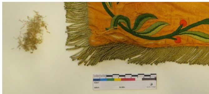
Detail van het versleten vaandeldoek