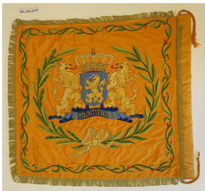
Achterzijde vaandeldoek