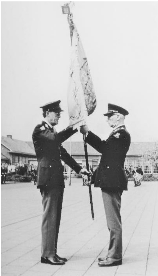
De overdracht van het vaandel op 1 mei 1974

ook onze nieuwe regimentscommandant. En dus verhuisde ons actieve vaandel met de vaandelkast in 2020 ook naar de gemeente Barneveld.