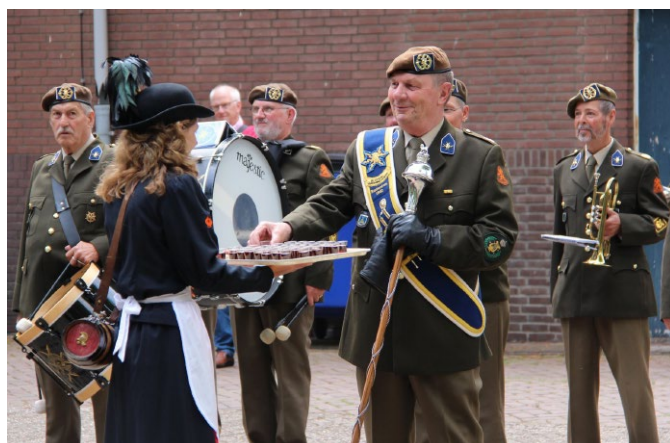
De marketentsters delen de traditionele Leeuwenbitter uit