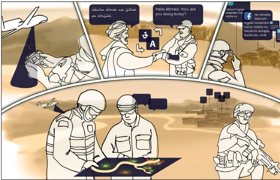
Illustratie: Rosie Paulissen (TNO)

gekoppeld tot een situatie-specifieke keten of dienst die aansluit bij de behoefte van die gebruiker op dat moment. Deze keuze komt flexibiliteit ten goede.