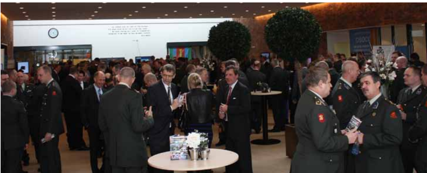
Symposium Nationale Inzet: netwerken tussen de bedrijven door

Dit team heeft de circa 300 aanwezigen proactief gespijsd en gelaafd. De dames en heren kwamen met bladen vol de foyer in, zodat iedereen in een mum van tijd voorzien was. Geen lange wachtrijen; alleen maar positief verraste gezichten. Dit hebben ze natuurlijk alleen kunnen doen dankzij de keukenbrigade, die klaarblijkelijk ook op deze snelle werkwijze berekend is.