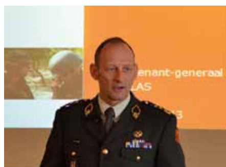
Commandant Landstrijdkrachten lgen Mart de Kruif

alleen tussen staten, maar ook op gebieden als cyber en terrorisme. Niettemin is in de beeldvorming de directe link tussen de krijgsmacht en de (internationale) veiligheid verminderd en daarom moet de krijgsmacht met minder geld toe. Dus moeten de capaciteiten slimmer worden ingezet; dubbelingen in de organisatie zijn uit den boze.