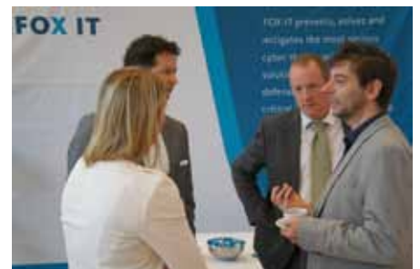
FOX IT ook een partner bij opleiden en trainen

Zolang er complexe IT-systemen zijn, zijn er kwetsbaarheden. Daarom verzorgt FOX IT gastcolleges en trainingen om cyberexperts op te leiden of om basale securitykennis over te dragen.