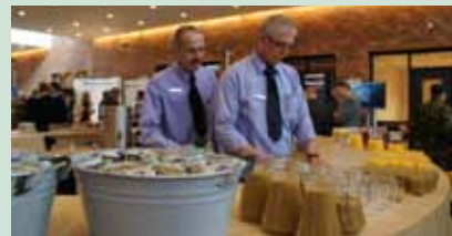
Paresto in actie

Garderen is een uitstekende locatie: een mooi gebouw, lekkere broodjes en een bijzonder parestoteam. Waar op andere locaties Paresto gewoon goed is, zijn ze in Garderen nog een tikje beter: daar werkt een door-en-door professionele parestobrigade.