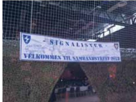
Sfeervol decor van het diner

Het Norwegian Army Signals Corps Ceremonial Dinner wordt voorafgegaan door een tweetal dagen van presentaties en bijeenkomsten om met elkaar van gedachten te wisselen over velerlei onderwerpen, zoals de Vereniging Officieren Verbindingsdienst dat twee keer per jaar doet met onze symposia.