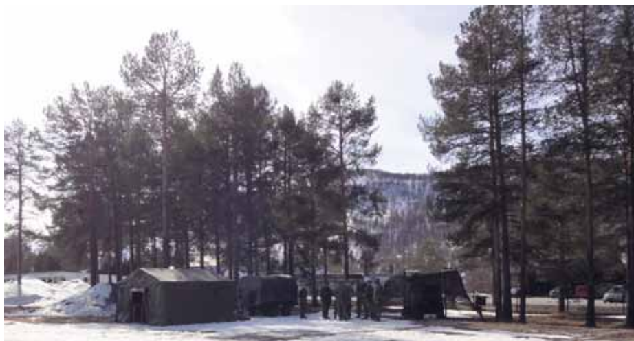
Impressie van de Static Show