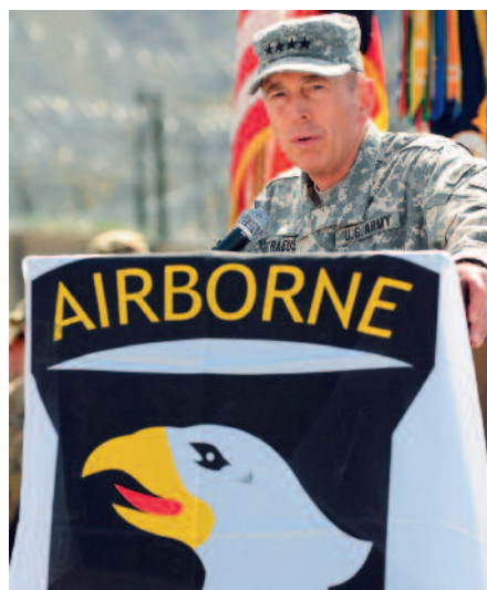
Generaal David Petraeus

Ook de informatie-uitwisseling met coalitiepartners onderling is van wezenlijk belang; als voorbeelden met GE en CA over de nieuwe missie in Kunduz; met Egypte en Golfstaten (Bahrein, Katar, Saoedi Arabie, VAE etc) over de 'voorjaarsrevolutie' en met NATO partners over mogelijke uitwisseling van NEO plannen bij evacuatie van NL per-