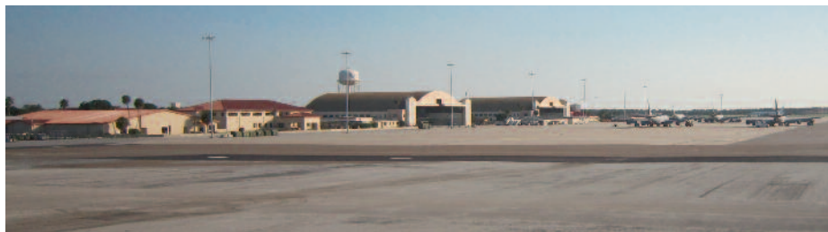
Macdill Airforce Base

In oktober 2002 voerde CENTCOM operaties uit in de Hoorn van Afrika om landen te ondersteunen in het bevechten van terroris-