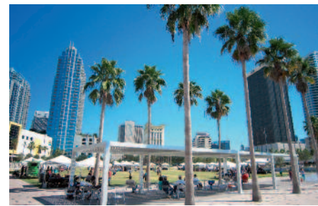
Sfeerimpressie Tampa Florida

soneel. Tenslotte met CENTCOM en betrokken coalitielanden over hun intenties en inzet in Libië.