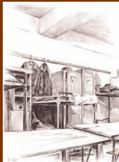
Een soldatenkamer van de A-Compagnie in december 1946