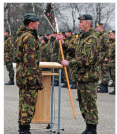
De overdracht van het fanion 102 EOVCie (boven)