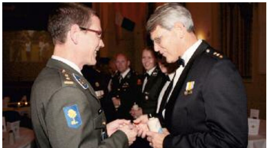
Regimentswaardering voor de Leden van de werkgroep Regimentsdiner

te hebben voor het individuele lid van het Regiment Verbindingstroepen of bij be-