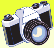
FOTO IMPRESSIE BD-EVENT 5 NOVEMBER 2009 LEZING HET ONTSTAAN VAN ZODIAC