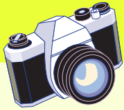
FOTO IMPRESSIE HOOGSTE PUNT AC-11