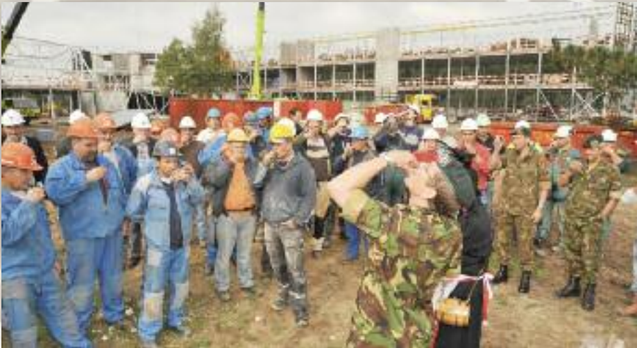
De gezamenlijke beeldronk