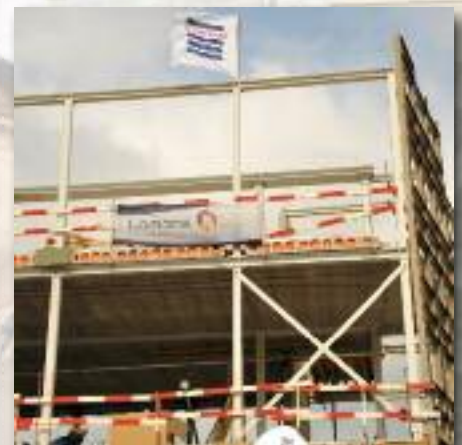
De vlag op het hoogste punt