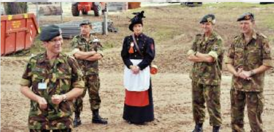
De toekomstige bewoners van AC-11