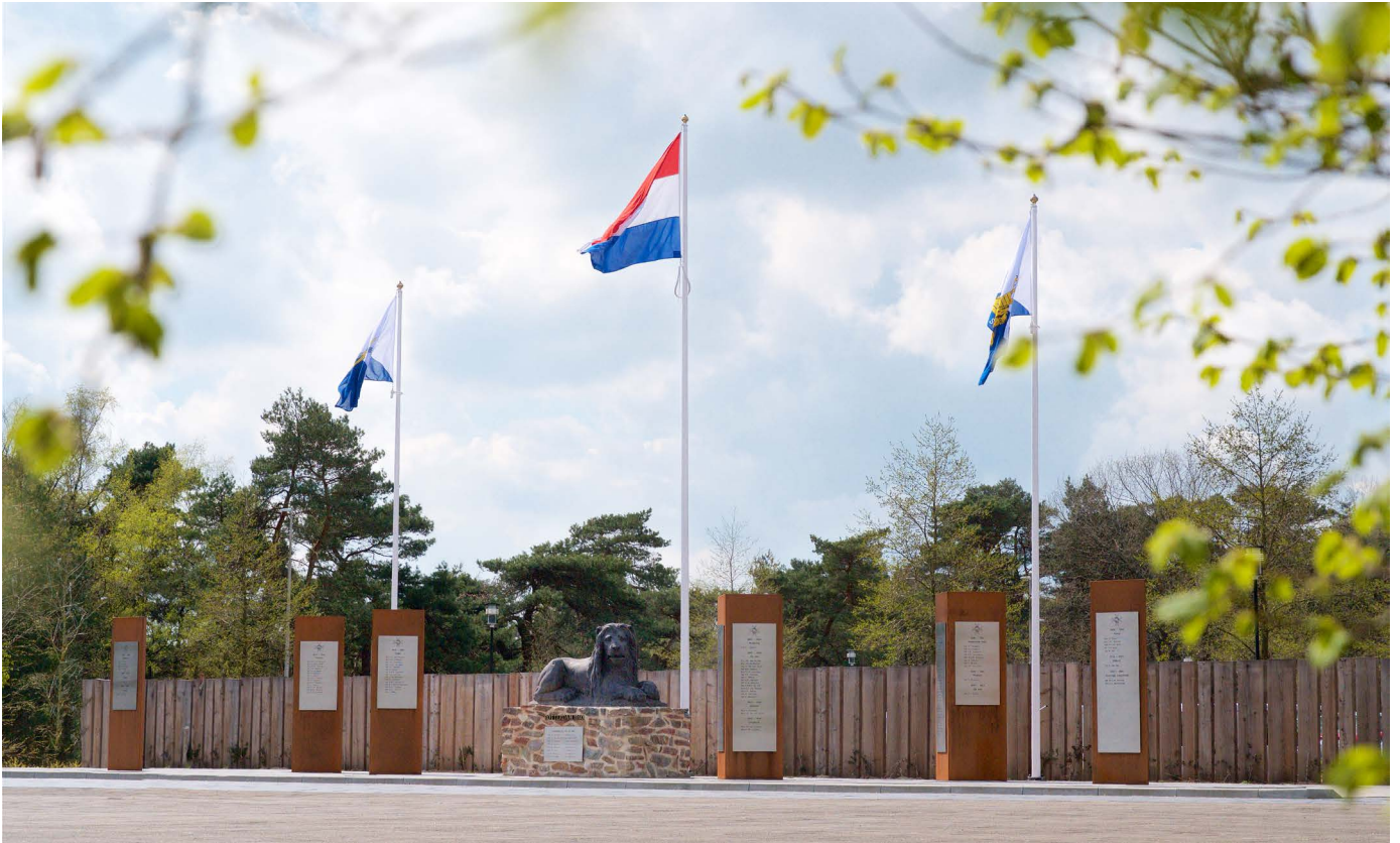
Het monument met onze Leeuw in het midden.

Ook binnen ons Regiment speelt de leeuw een grote rol. Onze Leeuw en zijn drie Rotterdamse broers stonden oorspronkelijk op de Koningsbrug of Vierleeuwenbrug in Rotterdam, de stad waar een belangrijk stuk van onze historie ligt. Natuurlijk staat er een Leeuw op ons vaandel en ook vormt de Leeuw het prominente middelpunt van het monument op het Veteranenplein in Stroe.