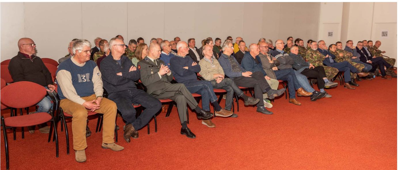
Na twee jaar weer een Leeuwenhart.