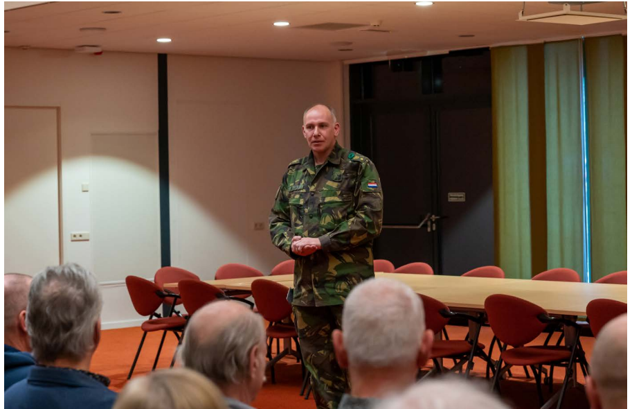
De RA heet iedereen welkom...

Toen in 2022 bleek dat Leeuwenhart weer niet kon doorgaan, werd besloten alle vrijwilligers een speciale Leeuwenhartcoin toe te sturen met daarbij een oorkonde. In eerste instantie zou dit eenmalig zijn. Maar de coin werd erg op prijs gesteld, dus werd er besloten om deze te blijven uitreiken aan nieuwe vrijwil-