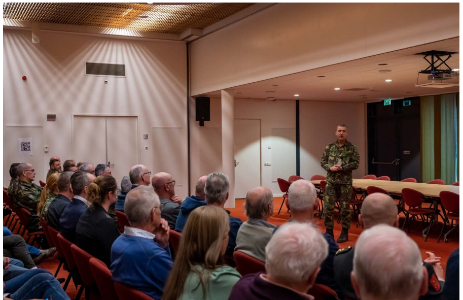
... en geeft het woord aan de RC.